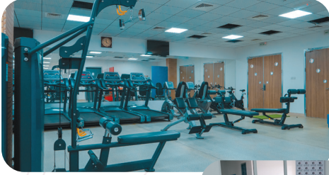
نادي رياضي للرجال وآخر للنساء Men and women Gyms