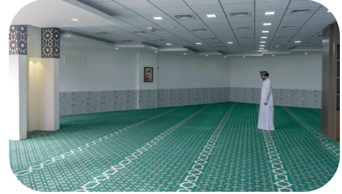
مصلّى للرجال ومصلّى للنساء Prayer Rooms for men and women