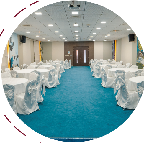
قاعة المؤتمرات Conference Hall