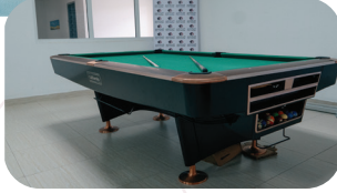
قاعة ألعاب للبيليارد والشطرنج Entertainment Hall for Billiards and Chess