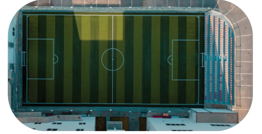
ملعب كرة القدم Outdoor Football Stadium