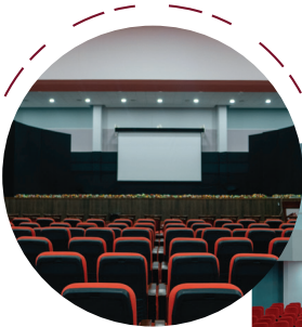
المسرح الداخلي Auditorium