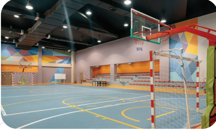
صالة رياضية مغلقة Indoor Stadium