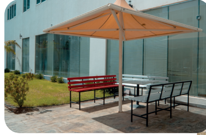
استراحات داخلية وخارجية